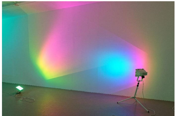
Ann Veronica Janssens, Hot Pink Turquoise , 2006 2 lampes halogène 750/1000 watt, filtre dichroïque couleur, 1 tripode Dimensions variables / Vue de l'exposition « Mars », IAC – Institut d'Art Contemporain, Villeurbanne, 2017 © Ann Veronica Janssens, Adagp Photo. Blaise Adilon, Courtesy the artist, IAC - Institut d'Art Contemporain, Villeurbanne and Kamel Mennour, Paris/London

Dans un registre inspiré de processus cognitifs (perception, sensation, mémoire, représentation), ses œuvres tendent vers un certain minimalisme, soulignant le caractère fugitif, éphémère ou fragile des propositions auxquelles elle nous convie. Spatialisation et diffusion de lumière, rayonnement de la couleur, impulsions stroboscopiques, brouillards artificiels, surfaces réfléchissantes ou diaphanes sont autant de moyens lui permettant de révéler l'instabilité de notre perception du temps et de l'espace. Les propriétés des matériaux (brillance, légèreté, transparence, fluidité) ou les phénomènes physiques (réflexion, réfraction, perspective, équilibre, ondes) sont ici questionnés avec rigueur dans leur capacité à faire vaciller la notion même de matérialité. Désireuse de dialoguer avec l'œuvre de Monet, l'artiste créera un environnement immersif et lumineux spécifique pour la salle du musée de l'Orangerie.