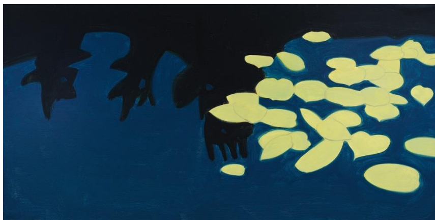
Alex Katz, Homage to Monet 1 , 2009, Oil on canvas, 121,92 x 243,84 cm (48 x 96 in)

Alex Katz a réalisé de petites études au fusain sur le motif et les a ensuite transposées dans de grandes toiles. C'est un ensemble de quatre à cinq très belles peintures qui seront montrées dans la salle du musée de l'Orangerie.