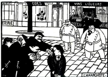
Félix Vallotton, L'Anarchiste , 1892

Fénéon milita pendant toute sa vie pour la défense de la liberté d'expression sous toutes ses formes. Ses convictions libertaires, qui remontaient au début des années 1890 alors qu'il était employé au ministère de la Guerre, ont soutenu son action en faveur d'une création sans hiérarchie ni préjugé. A une époque particulièrement agitée de l'histoire politique française, il mit sa plume au service de revues anarchistes comme L'Endehors de Zo d'Axa ou Le Père peinard pour lequel il rédigea des critiques en argot. Fénéon était proche des artistes qui partageaient ses convictions libertaires comme les peintres Seurat, Signac, Luce, Van Rysselberghe et les écrivains Gustave Kahn ou Victor Barrucand, tous militant en faveur de l'avènement de temps nouveaux. Accusé d'avoir participé à un attentat au restaurant Foyot situé en face du Sénat, Fénéon fut arrêté, emprisonné et jugé au cours du procès des Trente. Il fut acquitté à l'issue de sa plaidoirie pleine d'humour dont des extraits seront diffusés dans l'exposition.