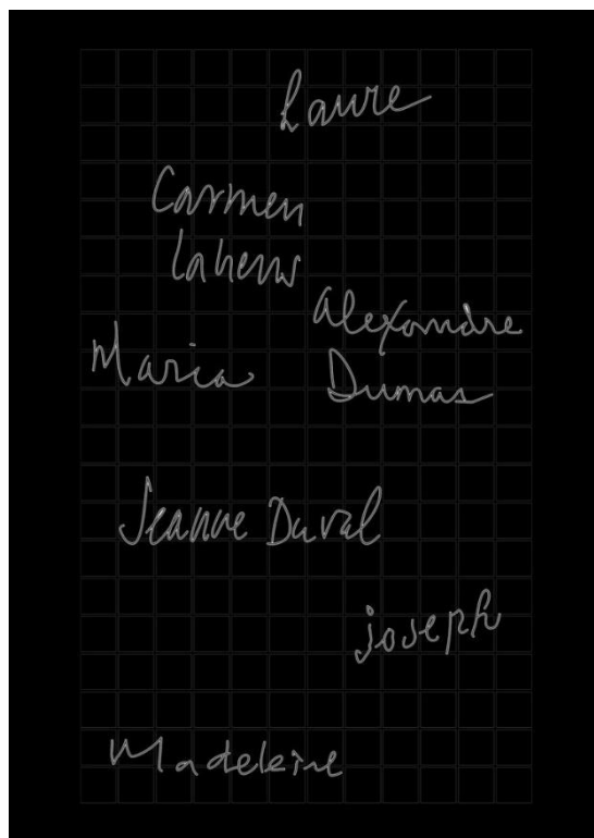
Glenn Ligon, image préparatoire, 2018

Musée d'Orsay, tours de la nef 26 mars – 21 juillet 2019