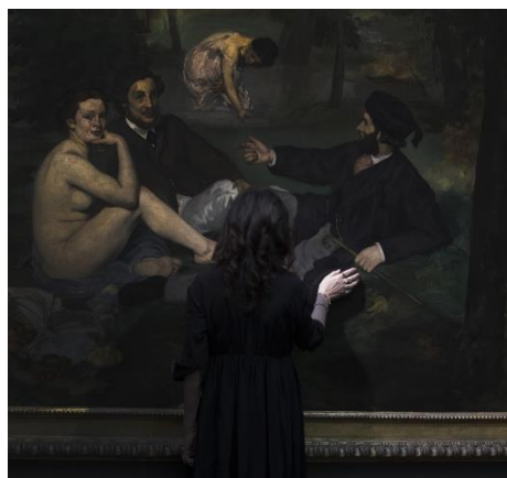
Sophie Calle, Hôtel de la Gare Sophie Calle – Manet, Déjeuner sur l'herbe (1863)

En 1978, la gare d'Orsay et son hôtel avaient été désertés. Les travaux de construction du futur musée n'avaient pas encore commencé. C'est à ce moment que Sophie Calle a poussé une porte qui a cédé et s'est choisi comme abri une chambre à l'abandon, la 501. Elle y a passé des journées entières, pendant plusieurs mois, avant son départ pour Venise qui devait marquer le début de son œuvre à venir. Pendant ce séjour, elle ressentit la désolation d'un lieu, comme un espace archéologique où tout avait été délaissé. Elle prit des photos, y invita ses amis, rassembla des documents, des objets, les fiches des clients qui étaient autant de vies ouvertes, les notes adressées à un employé de l'hôtel, nommé Oddo, dont elle imagina l'identité. On peut dire qu'à certains égards, Sophie Calle a développé sa méthode dans l'hôtel d'Orsay.