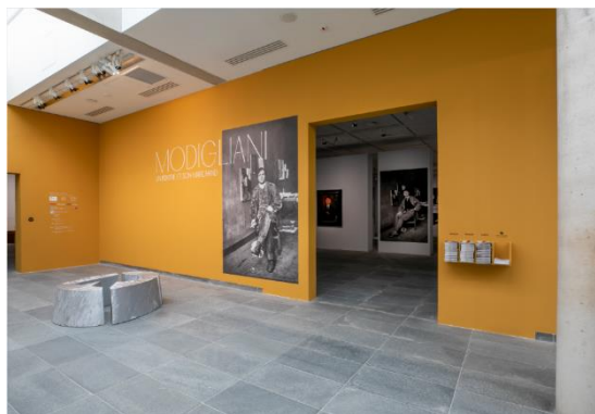
Entrée de l'exposition

Présentée du 20 septembre 2023 au 15 janvier 2024, l'exposition Amedeo Modigliani. Un peintre et son marchand a attiré 451 995 visiteurs , soit une moyenne journalière de 4 497 personnes sur 100 jours d'ouverture. Il s'agit de la meilleure fréquentation d'exposition de ces dix dernières années. En termes de fréquentation journalière, Modigliani est suivie de Matisse. Cahiers d'art, le tournant des années 30 en 2023 (en deuxième position avec 4 469 visiteurs par jour) et Franz Marc / August Mäcke, 1909-1914 en 2019 (troisième position avec 3 998 visiteurs par jour) ; en termes de fréquentation sur la totalité de la période d'exploitation, Modigliani tient tête à Tokyo Paris, 2017 (419 740 visiteurs sur nombre de jours d'ouverture) et Nymphéas. L'abstraction américaine et le dernier Monet, 2018 (402 994 visiteurs).